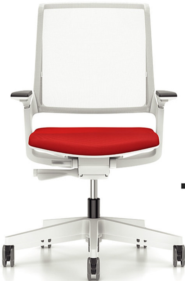
MOVY IS3 14M3

PRODUKTAUSWAHL SIEHE RÜCKSEITE WWW.INTERSTUHL.COM/MOVY