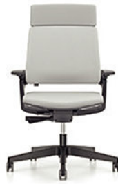
MOVY SS 23M3 mit Autolift-Mechanik € 479,-