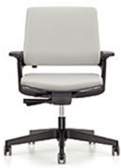
MOVY SS 13M3 mit Autolift-Mechanik € 389,-