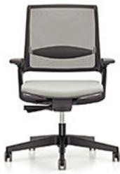
MOVY SS 14M3 mit Autolift-Mechanik € 389,-