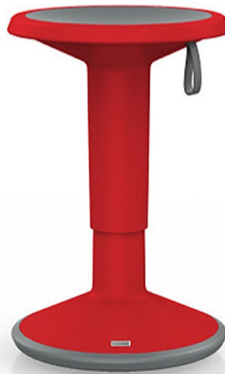
UP IS1 100U