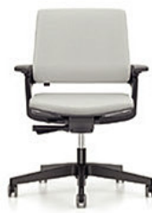
MOVY SS 13M6 mit Synchronmechanik € 389,-