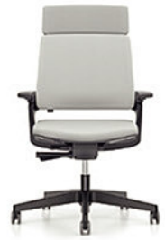
MOVY SS 23M6 mit Synchronmechanik € 479,-